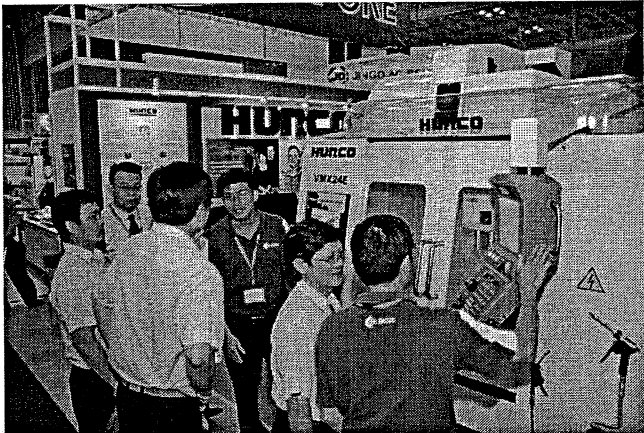
Khách tham quan được tư vấn về các giải pháp sản xuất mới tại MTA Vietnam 2012

Đây cũng là diễn đàn giới thiệu các thiết bị máy móc công cụ và gia công kim loại tiên tiến với sự góp mặt của 325 doanh nghiệp đến từ 21 quốc gia và vùng lãnh thổ.