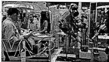
Một góc Triển lãm Quốc tế lần thứ 11 về máy công cụ, cơ khí chính xác và gia công kim loại 2013.