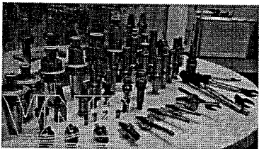
Một số sản phẩm gia công kim loại được trưng bày tại Triển lãm Quốc tế lần thứ 11 về máy công cụ, cơ khí chính xác và gia công kim loại 2013.

Triển lãm Quốc tế lần thứ 11 về máy công cụ, cơ khí chính xác và gia công kim loại (MTA Vietnam 2013) đã được khai mạc vào ngày 2/7/2013 tại Trung tâm Hội chợ và Triển lãm Sài Gòn (SECC), Quận 7, Tp.HCM.